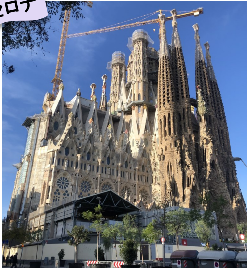
【石の聖書 サグラダ・ファミリア】

1882年から着工し、100年以上も建設中。2026年に完成予定。ガウディのコンセプトを形にする言葉の力を体験。