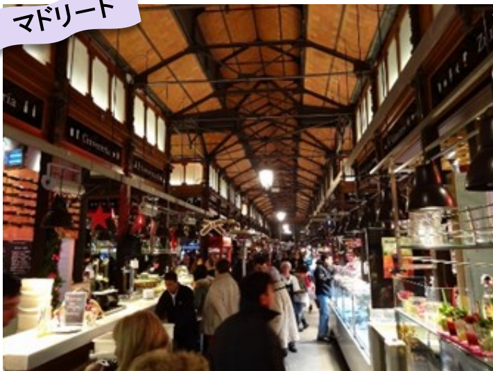
【サン・ミゲル市場】

1916年5月に生鮮食品卸売市場としてオープンした100年以上の歴史を誇る市場。2009年5月に改装しガストロノミー・マーケットとして生まれ変わったバルの集合体。地元の食材や珍味が揃う。年間1,000万人以上が訪れる。