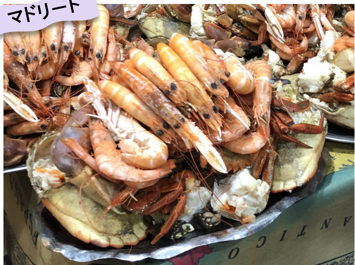
【リベラ・ド・ミーニョ】

独自一番商品!! わいわい会話も弾む! 元祖てんこ盛り海老・カニ・海鮮レストラン